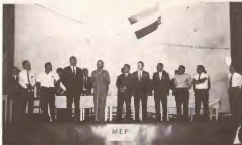
Señor Betico Croes dirigiendo palabra durante fundacion di e partido político M.E.P. na año 1972 den teatro Rialto.